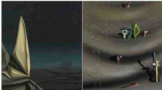
■ Kay Sage, 'Midnight Street', 1944 y Yves Tanguy, 'Je te retrouve objet trouvé', 1938.

Entre artistas y amantes hay parejas conocidas como Frida Kahlo, con un imponente auto retrato de 1940, y Diego Rivera, una fotografía alejada de ella. "Esta pareja ha invertido sus papeles con el tiempo; cuando estaban juntos él era el famoso y ella estaba en la sombra, ahora, sin embargo, ella es más conocida como artista que él", recuerda Pilar del matrimonio que se casó dos veces. La pareja formada por el surrealista Yves Tanguy y Kay Sage es una verdadera revelación . Podrían llamarse "los difuminados" por la esmerada habilidad con la que ambos funden colores y componen imprecisos fondos cromáticos de los que surgen contrastadas figuras.