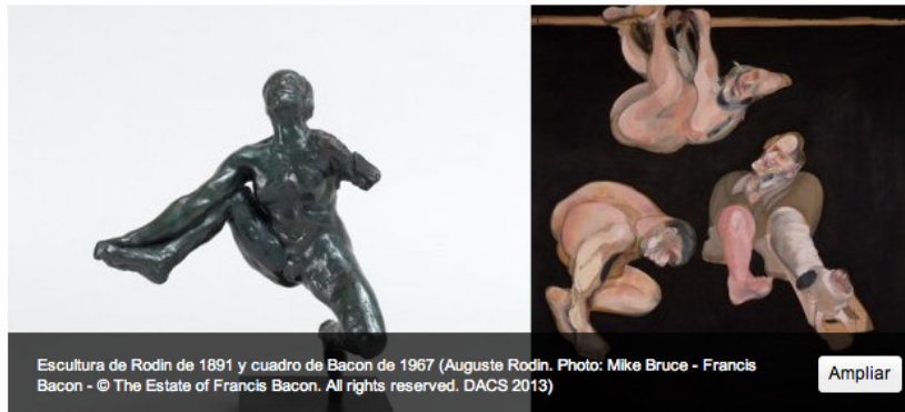
Escultura de Rodin de 1891 y cuadro de Bacon de 1967 (Auguste Rodin. Photo: Mike Bruce - Francis Bacon - © The Estate of Francis Bacon. All rights reserved. DACS 2013)