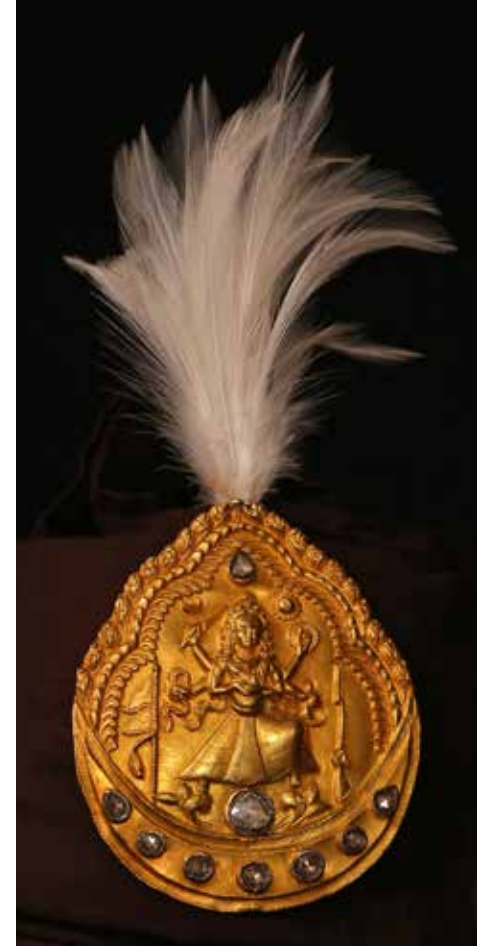
A FIANCO: sarpech in oro e diamanti del tardo '800, India o Nepal (da Susan Ollemans). IN BASSO: "Venere Fortuna", bronzo di Libero Andreotti (da Laocoon gallery).

'800; un paio di orecchini in smalto e diamanti a forma di pesce del Rajasthan, del XIX secolo. ( www.ollemans.com ).