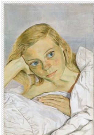
Chica en la cama, 1952

Aunque su origen es alemán, nieto del padre del psicoanálisis, se considera un artista británico ya que su vida la pasó en Reino Unido. Su familia supo huir del fatal destino que muchos judíos sufrieron y se instalaron en el barrio londinense de Saint John's Wood. Nunca fue una persona fácil. Ya de niño lo echaron de varios colegios y no era por mal estudiante precisamente. A pesar de ello, pronto inició su carrera artística recibiendo comisiones y asistiendo a varias escuelas y universidades de Londres.