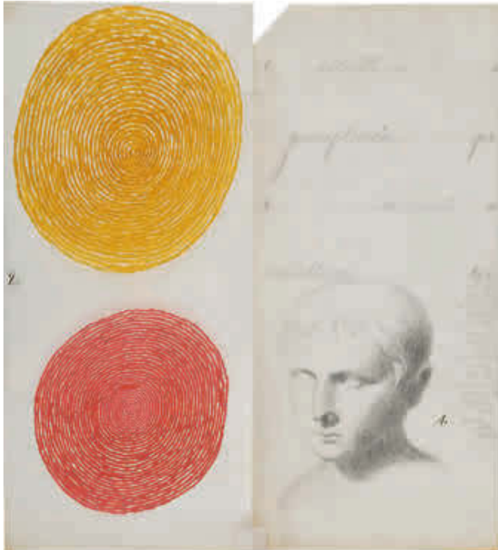
▶ ALWAYS DRAWING, EN LONDRES

1984 - Retratos , Galería de la Oficina, Medellín, Colombia