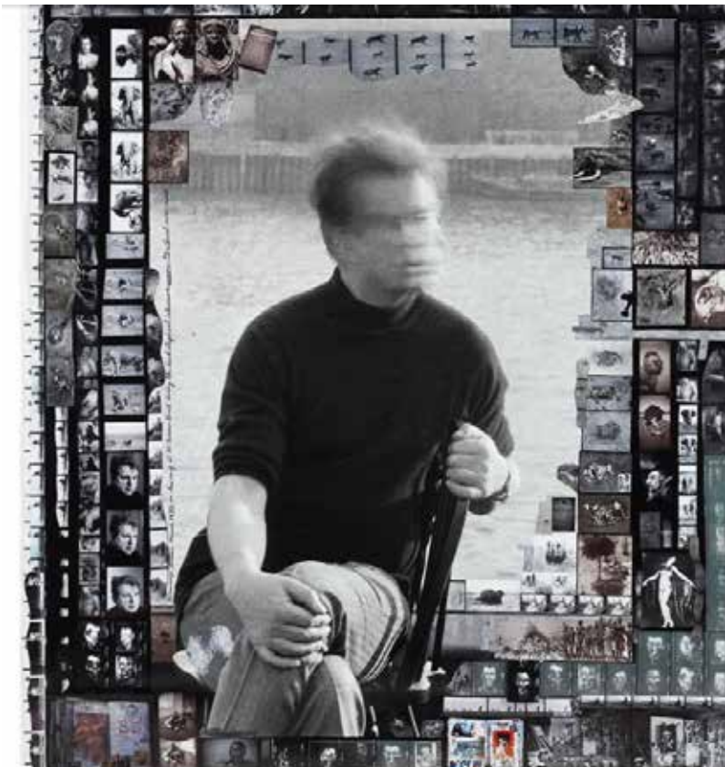
PETER BEARD, FRANCIS BACON ON HIS ROOF AT 80 NARROW STREET DURING THE DEAD-ELEPHANT INTERVIEWS. MARCH 1972/2013

Med det digitale projekt The Diary ønsker Ordovas Galleriet at dykke dybt ned i venskabet mellem de to ved at udforske personlig korrespondance, interviews, dagbøger og kunstværker. Galleriet håber, at dette vil kaste yderligere lys over venskabet og de to billedkunstneres værker.